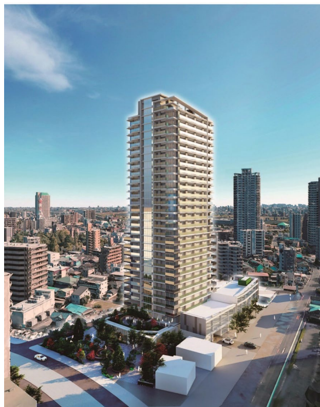
完成予想図（イメージ）